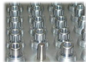
Кассетированная пресс-форма для производства защитного чехла рабочего тормозного цилиндра автомобиля ВАЗ.

Чтобы заказать деталь на базе EPDM в промышленных объемах, направьте в адрес нашего предприятия письмо-запрос с указанием годовой потребности, а также чертеж уплотнения. Вам будет направлено коммерческое предложение.